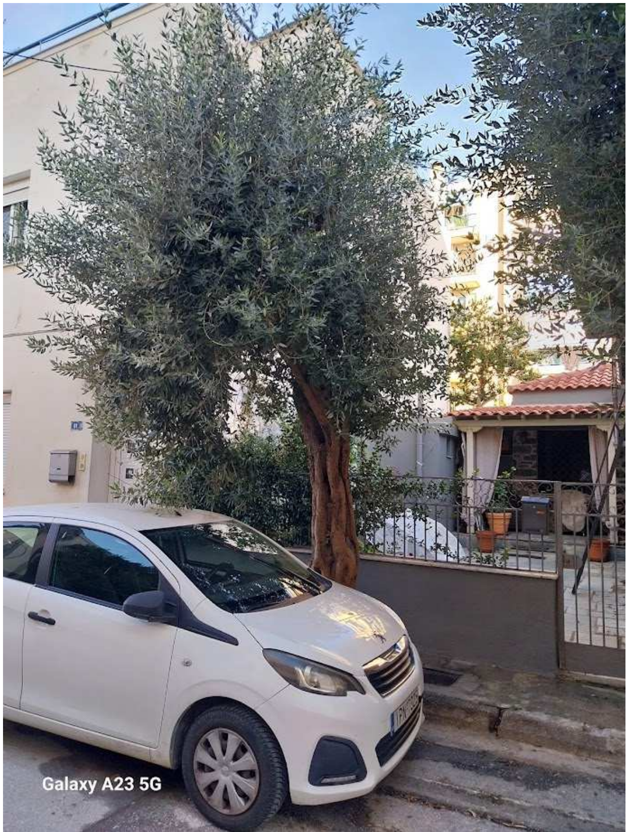
Galaxy A23 5G